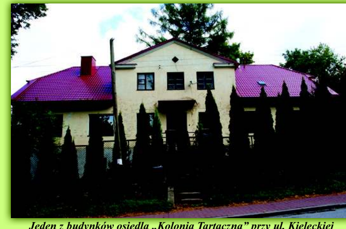
Jeden z budynków osiedla „Kolonія Tartaczna” przy ul. Kieleckiej (w latach 50. gościli w nim Maria Dąbrowska i Wojciech Żukrowski)