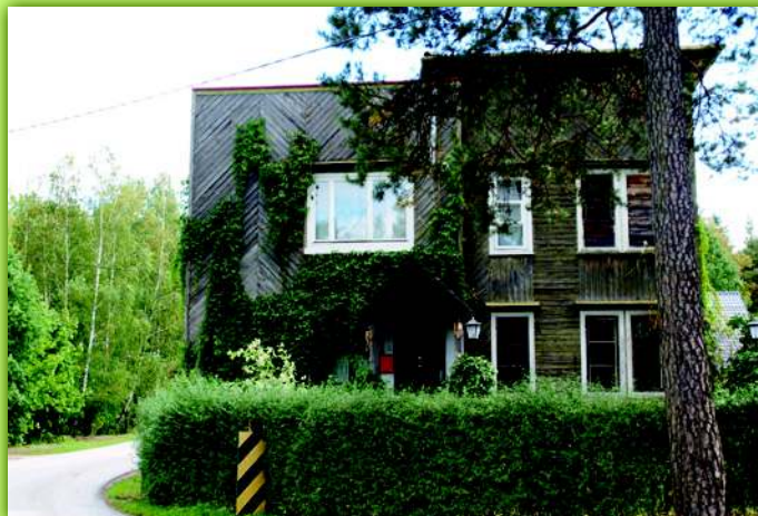
Budynek administracji Nadleśnictwa postawiony w międzywojniu (obecnie należący do Zakładów Przemysłu Drzewnego – ul. Przemysłowa 7)