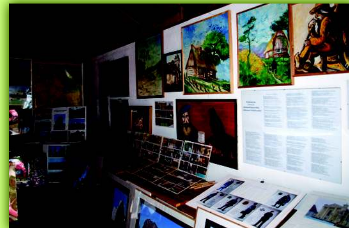
Działy: etnografii i dokumentacji fotograficznej