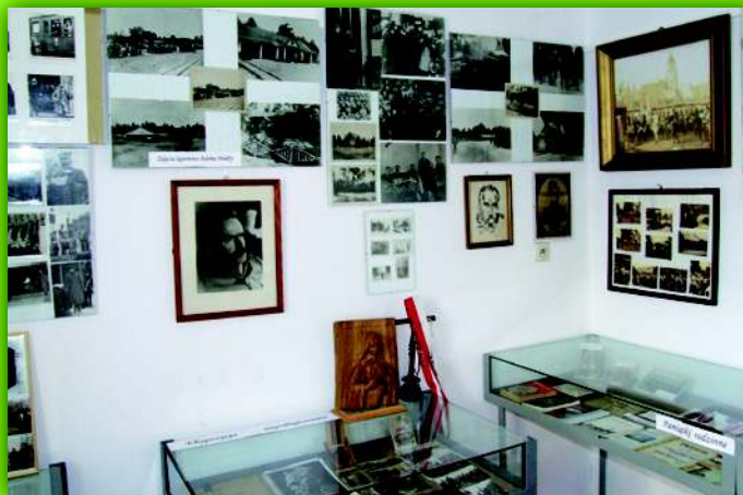
Pamiątki związane z Józefem Piłsudskim