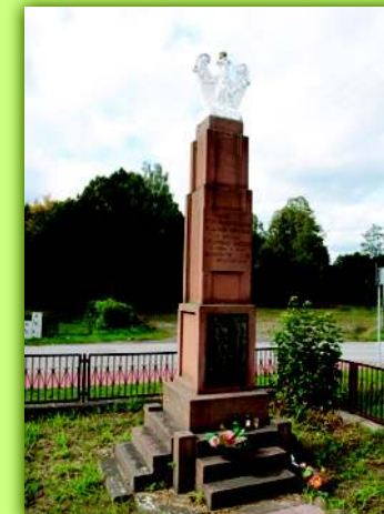
Pomnik ofiar II wojny światowej w centrum Samsonowa