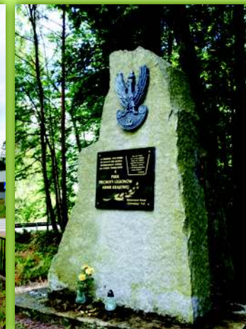
Pomnik żołnierzy IV Pułku Piechoty Legionów AK w lesie pod Siodłami