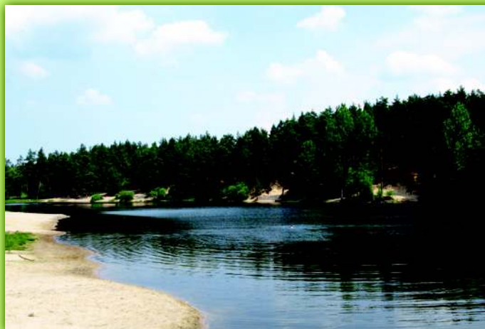
Zalew na Bobrzy w Kaniowie