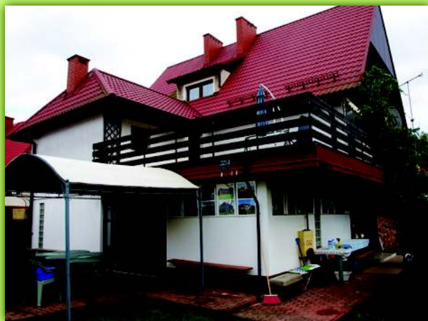
Wydawca folderu – Świętokrzyskie Towarzystwo Regionalne

W Izbie Regionalizmu Świętokrzyskiego mamy kilka działów, najważniejszym z nich jest dział wydawnictw Biblioteki Świętokrzyskiej – ponad 310 pozycji książkowych, dział geologii, etnografii, dokumentacji fotograficznej oraz dział związany z podróżami gospodarza Ośrodka, Macieja A. Zarębskiego, lekarza, pisarza i fotografa. Ośrodek można zwiedzać w poniedziałki i czwartki w godzinach 10-18.00, po uprzednim zgłoszeniu telefonicznym 602 467 948 lub 41 300 1558.