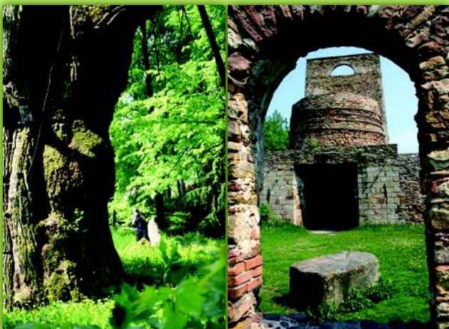
W cieniu legendarnego Bartka Widok na ruiny huty w Samsonowie