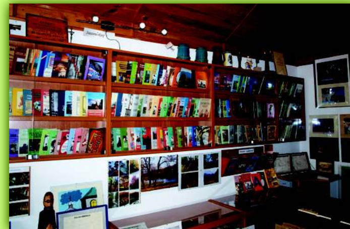
Ekspozycja wydawnictw Biblioteki Świętokrzyskiej