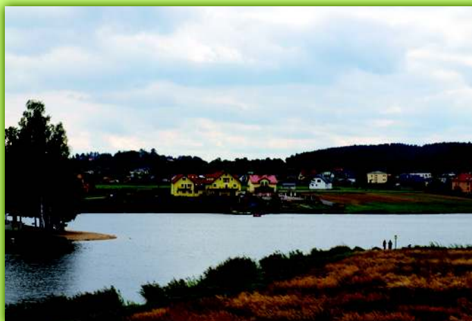
Zalew na Bobrzy w Umrze – w tle hotel „Pod Jaskółką”