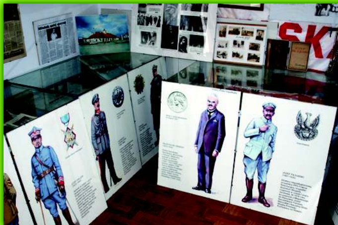
Fragment wystawy „Twórcy Polski Niepodległej”