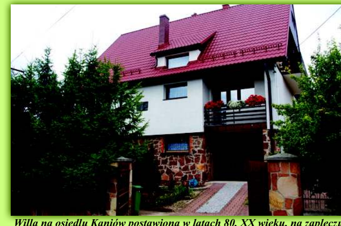
Willa na osiedlu Kaniów postawiona w latach 80. XX wieku, na zapleczu której w lipcu 2004 r. otwarto Ośrodek Regionalizmu Świętokrzyskiego