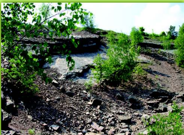
Fragment góry Chelm, gdzie w roku 2010 odkryto ślady Tetrapoda