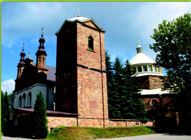
Zabytkowy kościół pw. św. Rozalii i Marcina wybudowany w XVI w. Rozbudowany na początku XX wieku